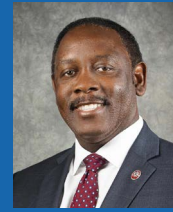
ALCALDE DEL CONDADO ORANGE JERRY L. DEMINGS