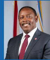
ALCALDE DEL CONDADO DE ORANGE JERRY L. DEMINGS