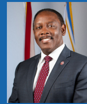
ALCALDE DEL CONDADO DE ORANGE JERRY L. DEMINGS