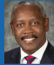
ALCALDE DEL CONDADO DE ORANGE JERRY L. DEMINGS

DESDE LA CARRETERA ESTATAL SR 50 HASTA LA CARRETERA LAKE PICKETT ROAD